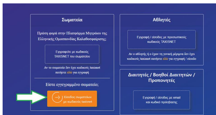
Εικόνα 1: Αυθεντικοποίηση σωματείου

Για να εκκινήσετε την διαδικασία υποβολής αίτησης επιστροφής χρημάτων αναπτυξιακού για λογαριασμό του σωματείου σας, θα πρέπει να επισκεφθείτε την ηλεκτρονική διεύθυνση https://apps.basket.gr (εικόνα 1) και να αυθεντικοποιηθείτε επιτυχώς (κάνοντας χρήση του λογαριασμού taxisnet του σωματείου σας).